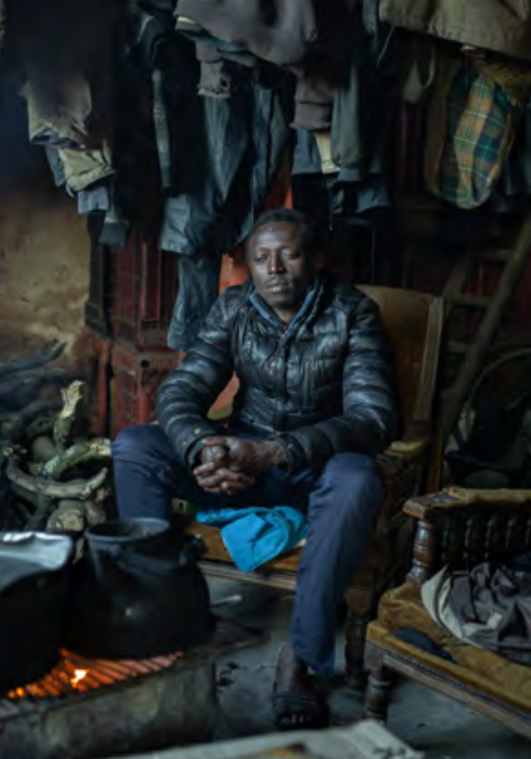
Während der Erntesaison leben die Wanderarbeiter oft in Unterkünften ohne Elektrizität und fließendes Wasser.

oder Bauernhäusern. Die italienische Agrar-Gewerkschaft FLAI-CGIL schätzt, dass es in ganz Italien für die Arbeit im Obst- und Gemüseanbau zwischen 60-80 informelle Slums gibt, in denen ca. 100.000 Menschen leben. Aus EU-Mitteln hat die Gemeinde Rosarno 30 Wohnungen und ein weiteres Lager für Wanderarbeiter*innen erbaut. Infolge des Widerstands der einheimischen Bevölkerung gegen die Nutzung dieser Unterkünfte stehen diese jedoch leer.