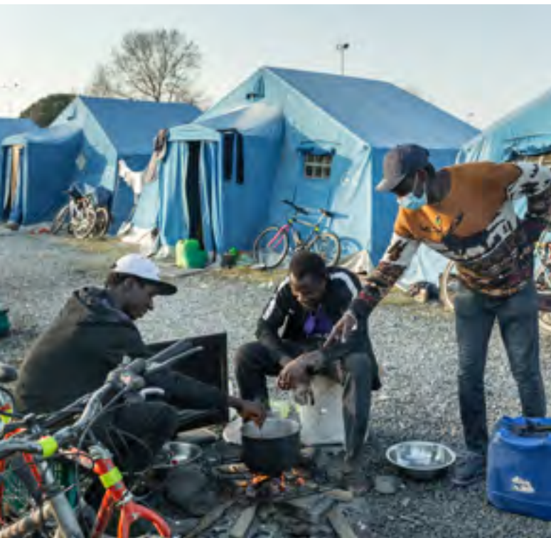
Im Camp kochen die Erntehelfer gemeinsam im Freien über offenem Feuer.

Zivilgesellschaft bekannt werden, finden keine Berücksichtigung in der Bewertung. So kommt es immer wieder zu Zertifizierungen von Agrarbetrieben, denen sogar Strafverfahren anhängig sind.