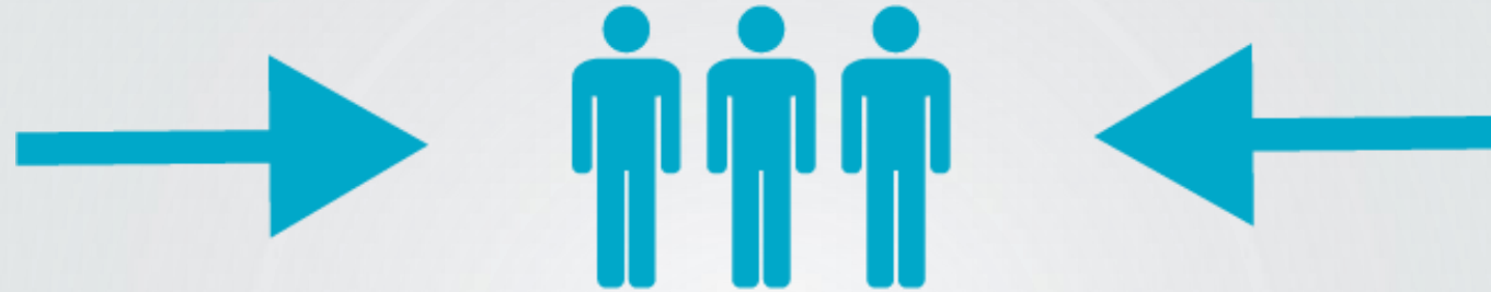
WIRKUNG NACH INNEN